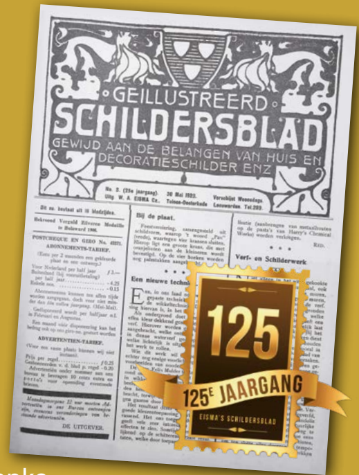
TEKST: ADRIAAN VAN HOOIJDONK FOTO'S: EISMA'S SCHILDERSVAKMEDIA

Eisma's Schildersblad beleeft dit jaar zijn 125e jaargang. Het Geïllustreerd Schildersblad van de Leeuwarder W.A. Eisma groeide uit tot een onafhankelijk kennisplatform voor professionals uit de schilders- en onderhoudsbranche. “Wij staan voor verdiepende vakinformatie en volgen de ontwikkelingen binnen de sector en de verfindustrie op de voet”, zegt hoofdredacteur Wouter Mooij.