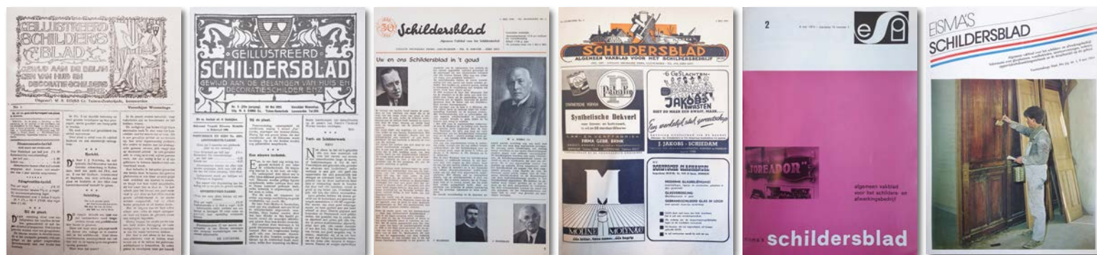
EISMA'S SCHILDERSBLAD 1899 - 2023